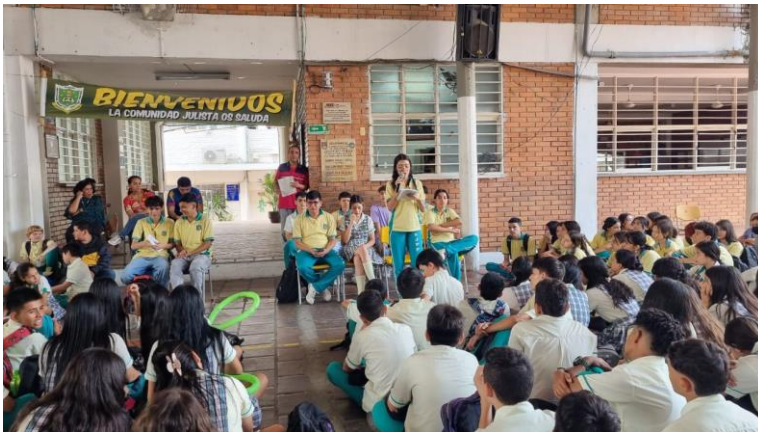
Segundo Debate de los Candidatos a Contraloría y Personería.