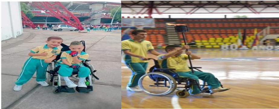
Celebración de la fiesta deportiva julista promoviendo la política de inclusión de la institución.