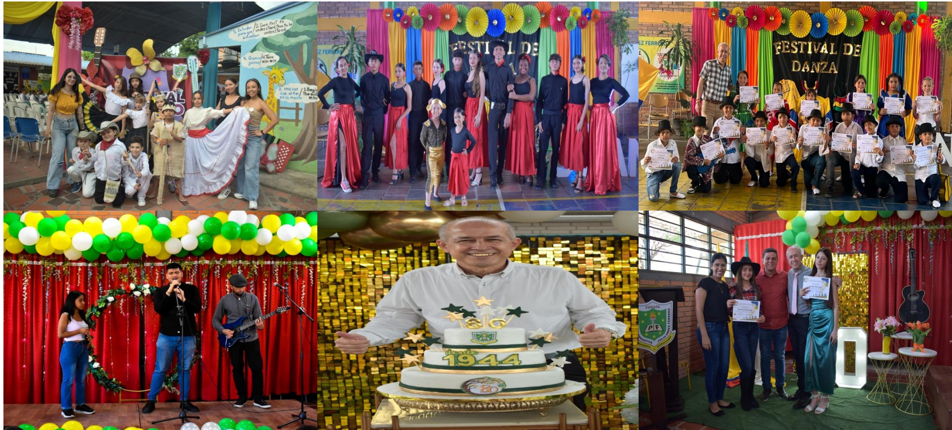
Celebración de la institución educativa de sus 80 años en la semana Julista