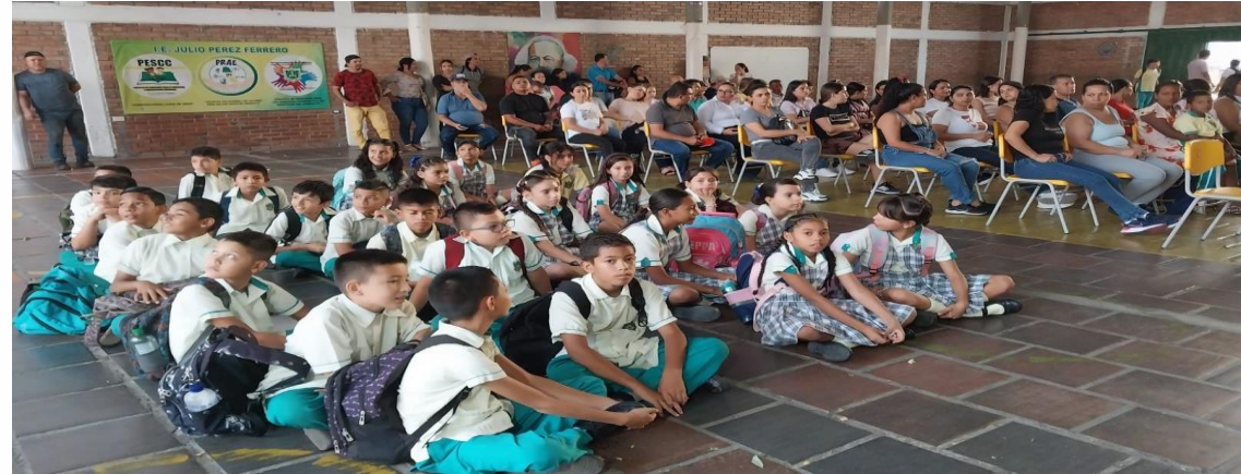
Transito armónico de bachillerato a primaria en la sede 1