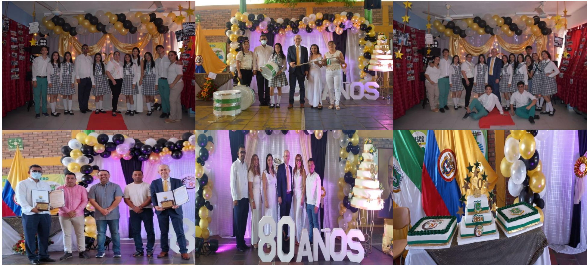
Celebración de la institución educativa de sus 80 años en la semana Julista