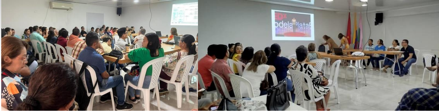
Jornada Pedagógica PIAR Docentes Bachillerato en el Auditorio HACARÍ de ASINORT.