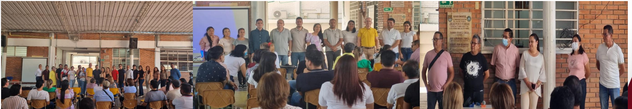
Instalación del consejo académico.