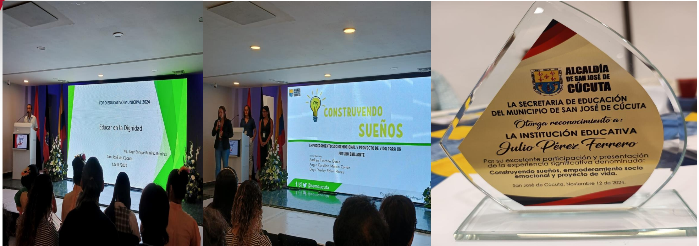
Participación de la institución educativa en el Foro Educativo Municipal FEM 2024.