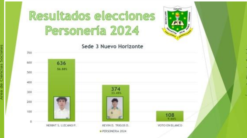
Jornada de elección de personería y contraloría.