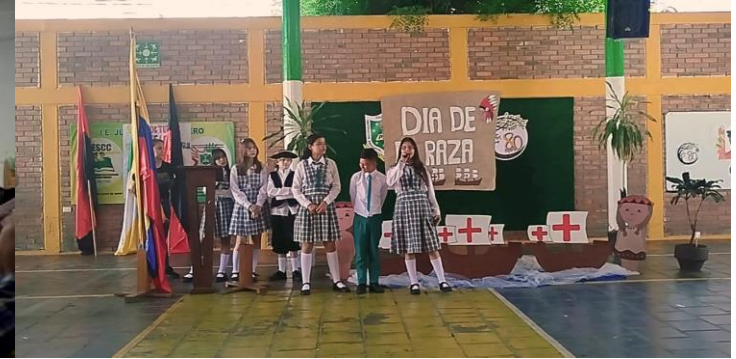
Celebración del día de la diversidad étnica y cultural.