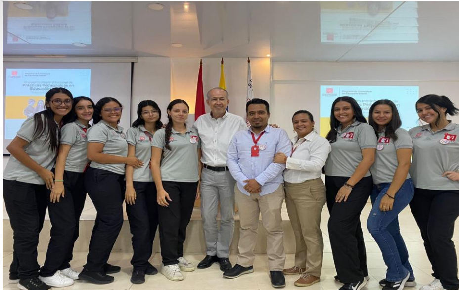
El Encuentro Interinstitucional de prácticas pedagógicas en Educación Infantil del programa de Licenciatura en Educación Infantil de La Universidad Francisco de Paula Santander.