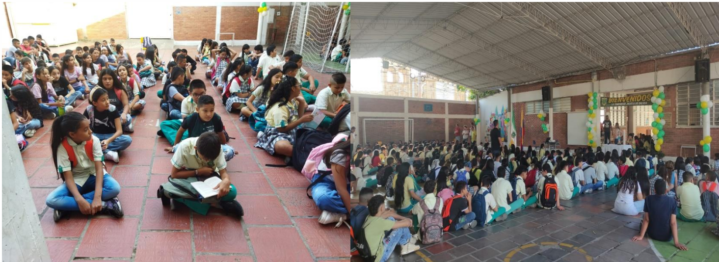
Inducción y reinducción de los estudiantes para el año 2024.