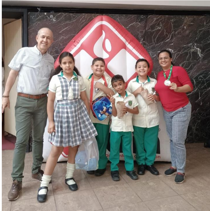
Participación en el Foro Ambiental de Cerámica Italia