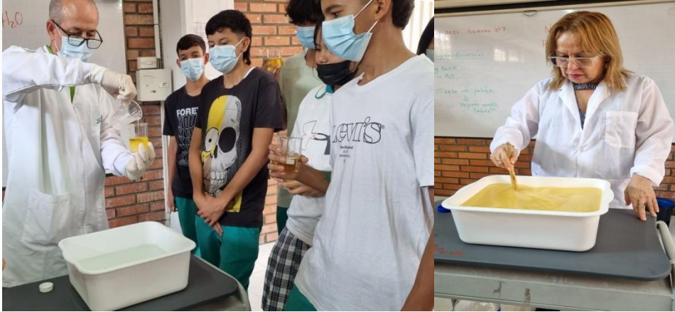
Laboratorio de Saponificación, como alternativa del buen uso del aceite usado.