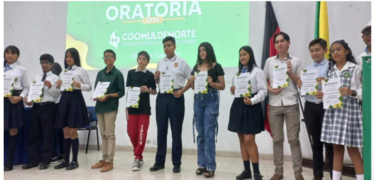
IV Concurso de Oratoria Coomuldenort