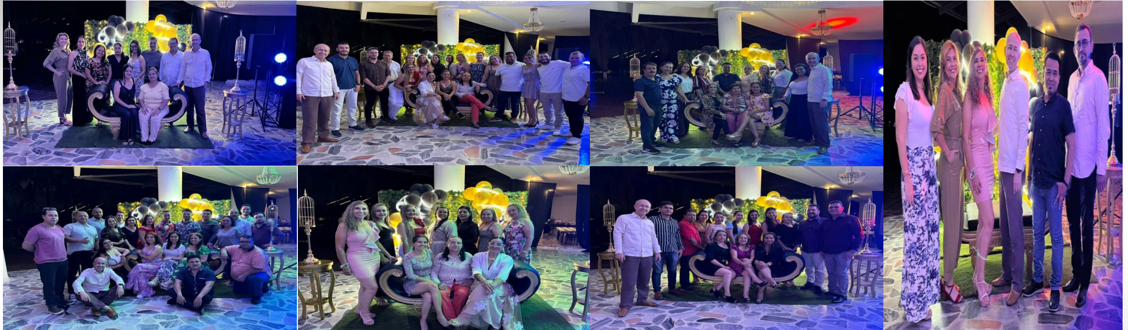
Equipo de docentes, personal administrativo, directivos y rector en la Celebración del 80 Aniversario.