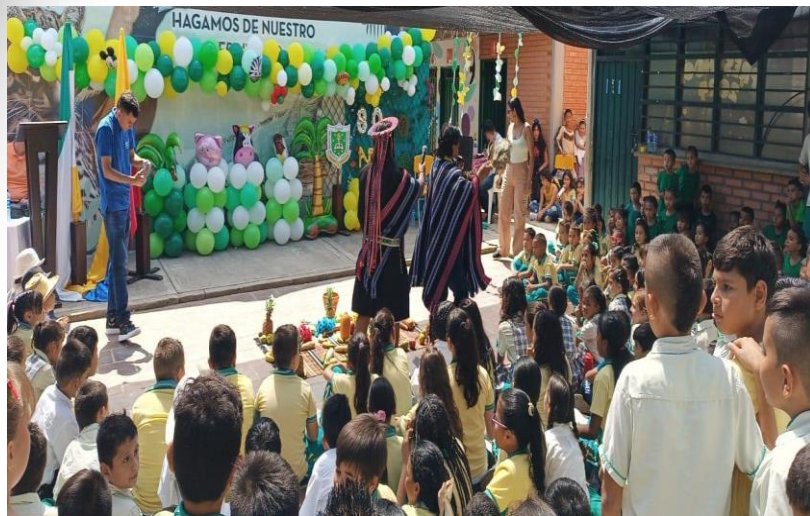
Agradecimiento a la Pacha Mama por representantes de la comunidad indígena INGA de Cúcuta en Día del Idioma