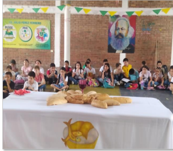
Catequesis sede 1