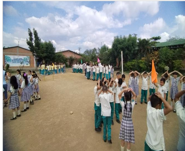
Simulacros 2024 por sedes