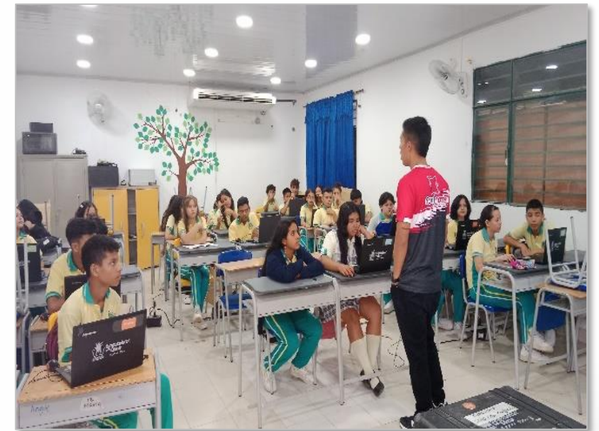
Alianza COMFANORTE y COMFAORIENTE con instructores especializados tecnología y deportes