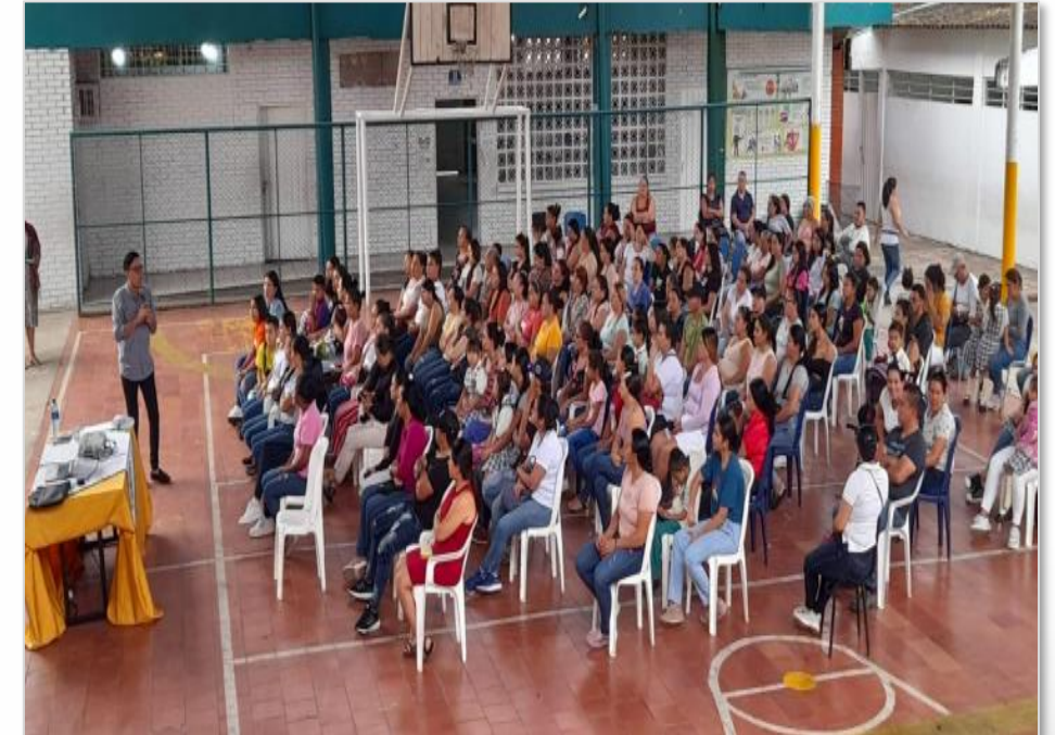
Encuentros de familia en las sedes