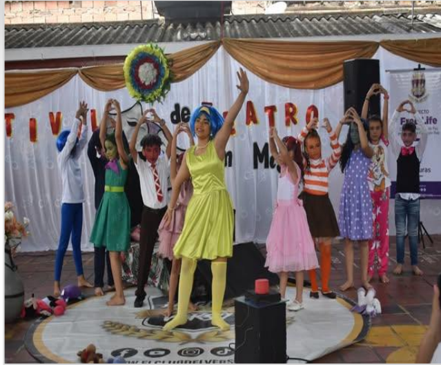
Festival de teatro