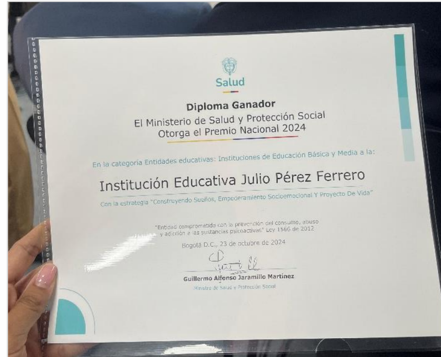
Premio Nacional de Buenas Prácticas