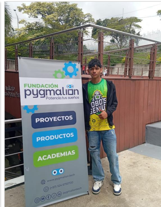
Proyectos de Robótica en Medellín Tecnacademia SENA