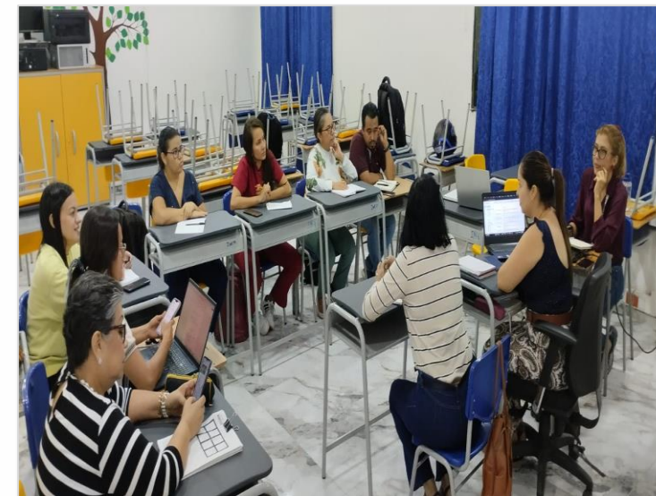
Reunión con el Equipo de Inclusión 2024