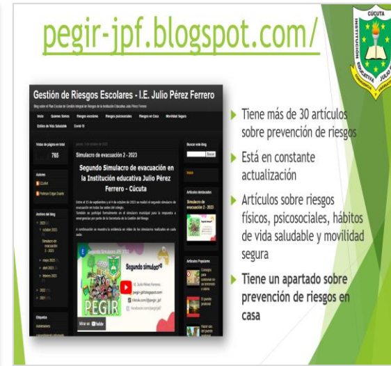
Blog de PEGIR