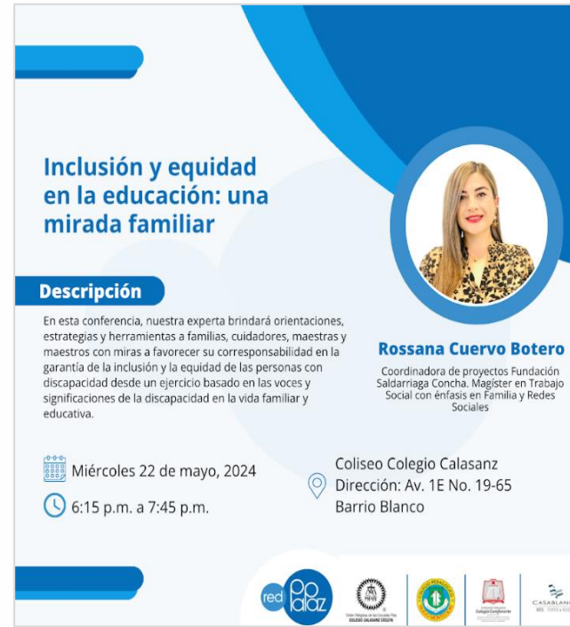
Talleres de Redpapaz