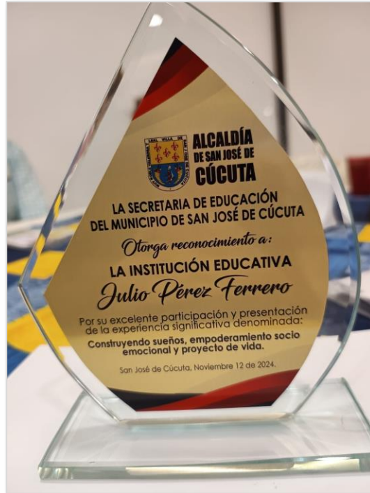
Reconcomiendo Institucional Foro Municipal