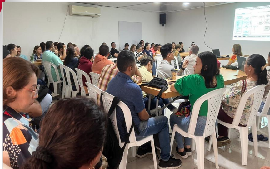
Capacitación PIAR en ASINORT de parte de la SEM