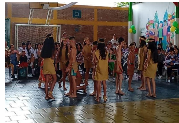
Presentación de Danza indígena en la semana julista