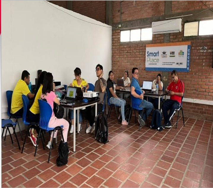
Uso del Smart Lab sede Simón Bolívar