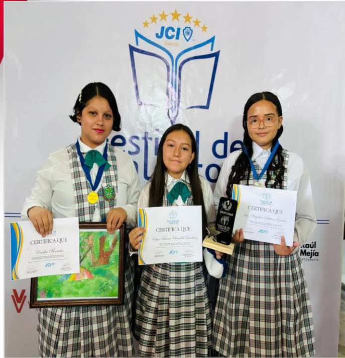
Festival de Talentos Cámara Junior JCI