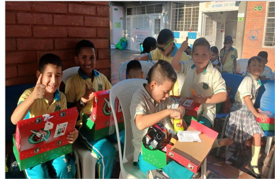
Regalos de Samaritan's Purs