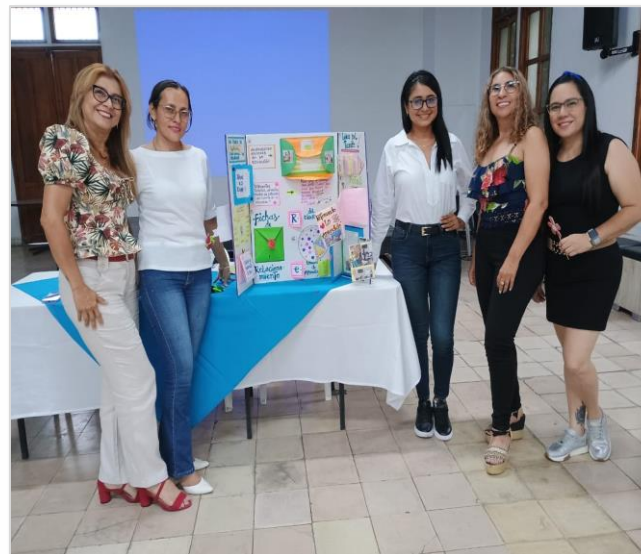
Presentación de Prácticas Pedagógicas aplicando DUA en la biblioteca pública