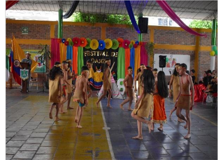
Festival de Danzas