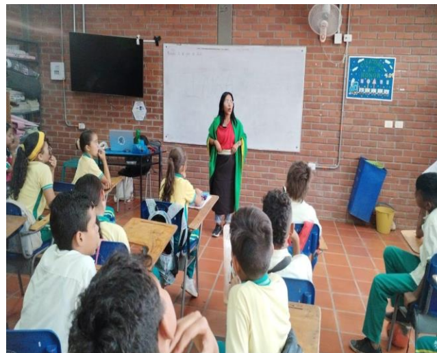
Representante de la comunidad INGA explicando aspectos de su cultura