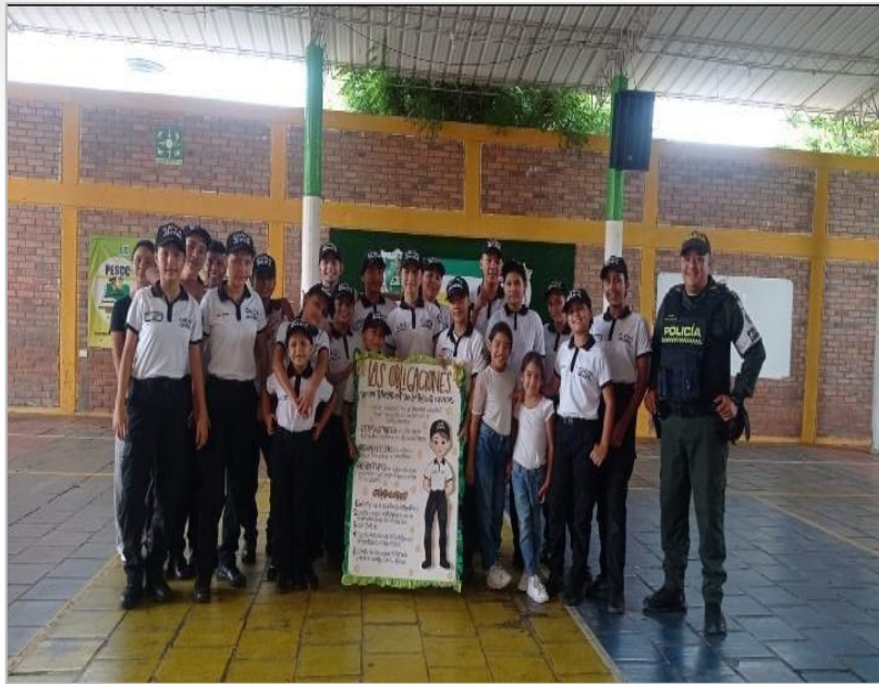
Policía Cívica Sede 1