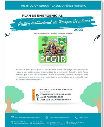
Plan de Gestión de Riesgos