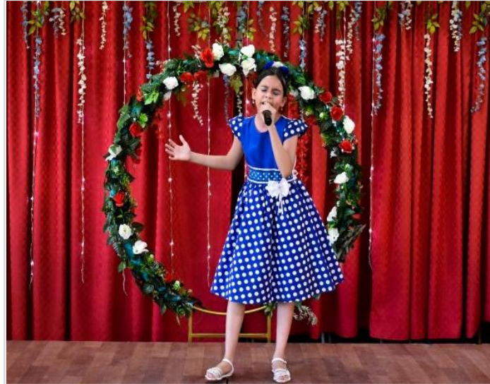
Festival de Canción