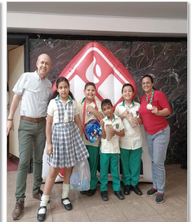
Reconocimiento Cerámica Italia Acciones contra el Cambio Climático