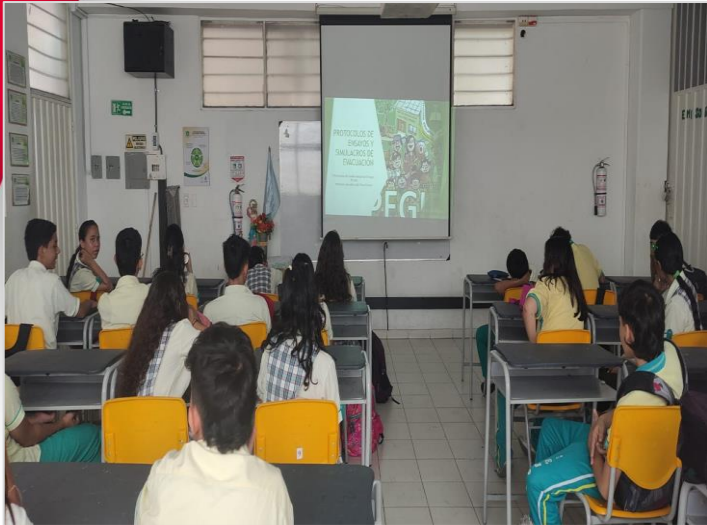
Sensibilización de PEGIR por sedes