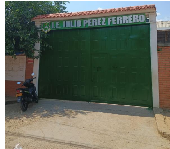
Cambio de portón sede 3