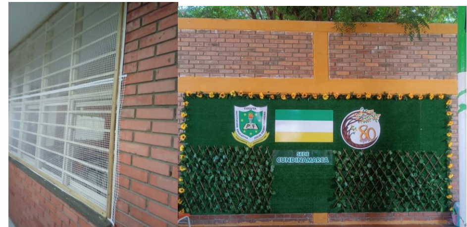
Mejoramiento de muro verde e instalación de malla en ventanas para evitar el ingreso de palomas