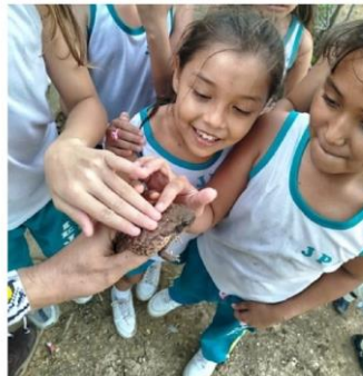
Figure 3: Children from local communities (northern Cúcuta, Colombia) connecting with frogs and toads—for many, their first direct encounter with these animals. Activity held at the Julio Pérez Ferrero Educational Institution, Norte de Santander. Shown here: the Horribilis toad ( Rhinella horribilis ).

The website allows users to interact with various areas of the regions, explore information about the authors, partners, threats, and land cover. Each frog icon on the map opens a window into a world of sounds and images: photographs, recordings of calls, general descriptions, and links to additional resources. Furthermore, it