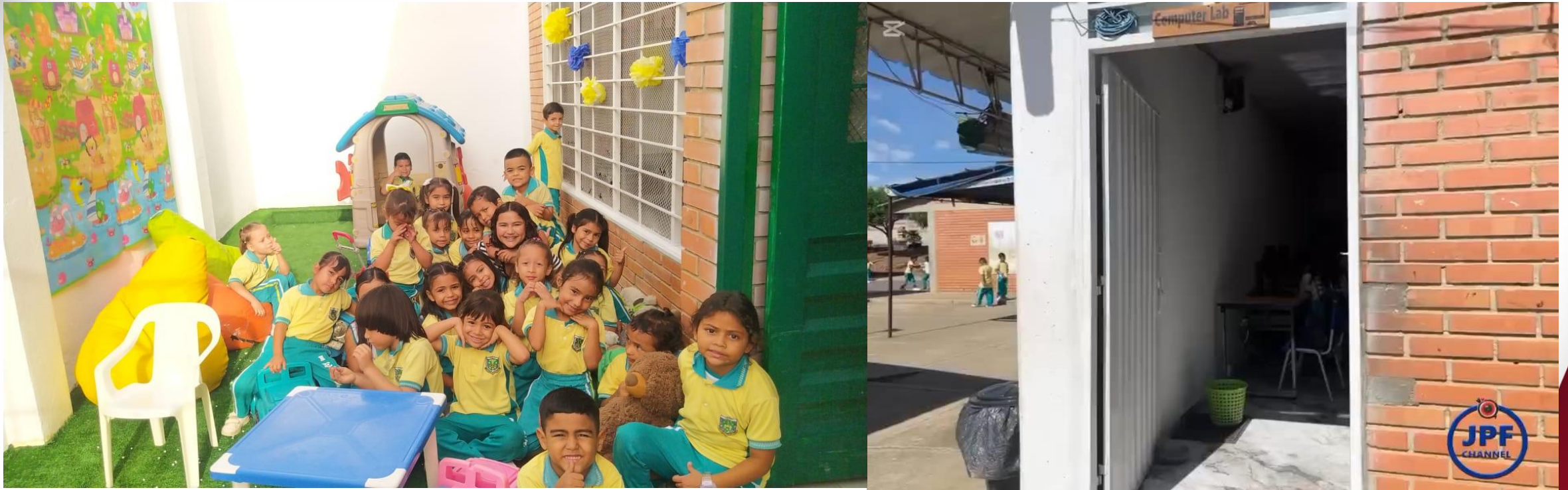
Adecuación de las aulas de Preescolar