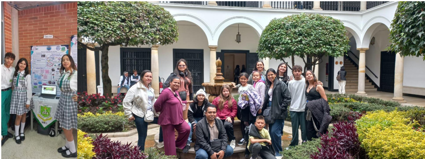
Participación en el encuentro Nacional de semillero de investigación con 4 proyectos