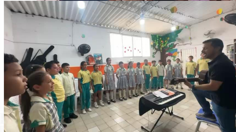
Desarrollos semanales de encuentros de centros de interés