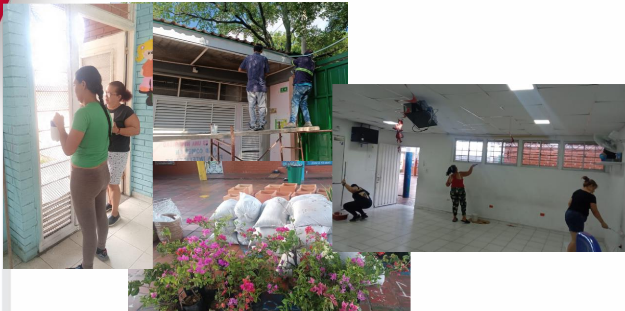
Embelllecimiento de aulas y espacios exteriores con apoyo de Consejo de padres y centrales eléctricas