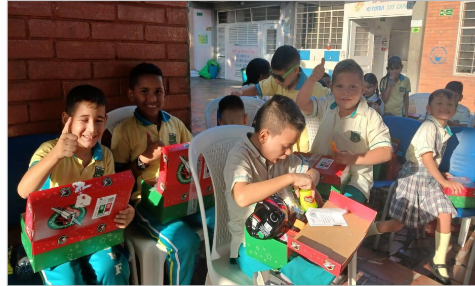
Regalos de Samarithan's Purs