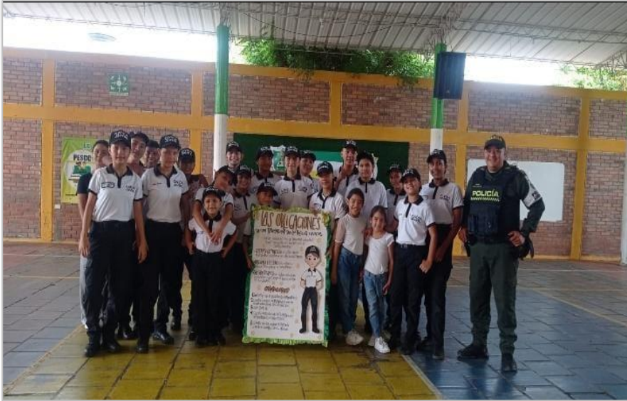
Policía Cívica Sede 1