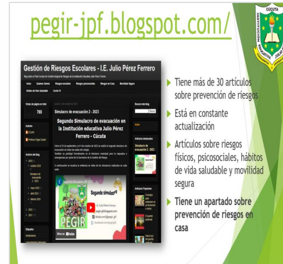
Blog de PEGIR