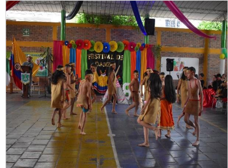
Festival de Danzas