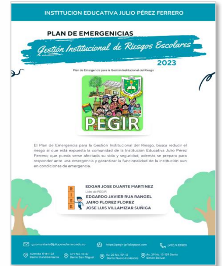
Plan de Gestión de Riesgos