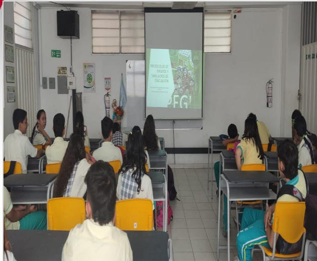
Sensibilización de PEGIR por sedes