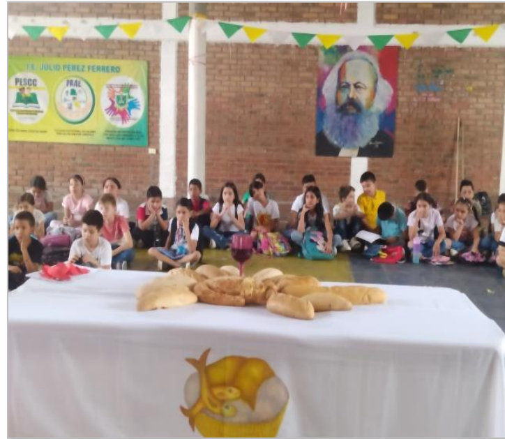
Catequesis sede 1