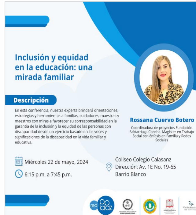
Talleres de Redpapaz