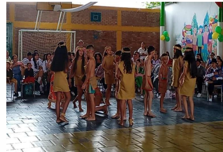
Presentación de Danza indígena en la semana julista