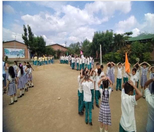
Simulacros 2025 por sedes